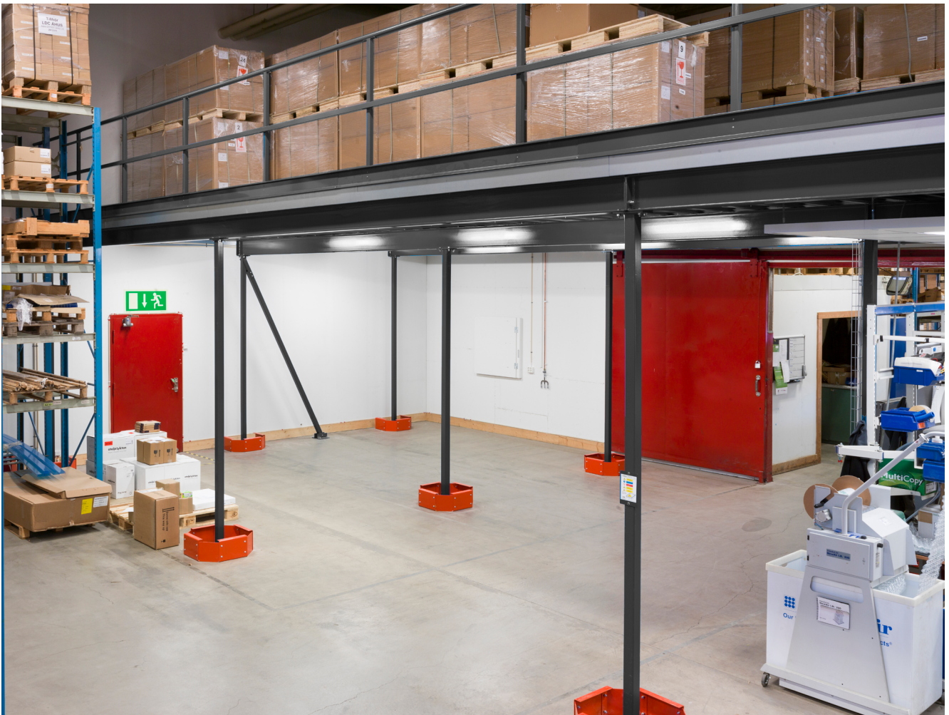
En entresol ger ett extra golvplan och frigör användbar golvyta.