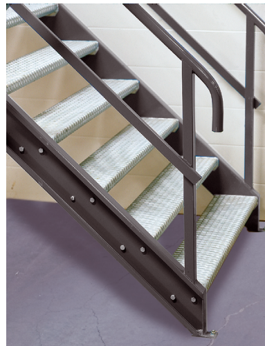
Trappa till entresolplanet. Stegen finns i olika utförande.