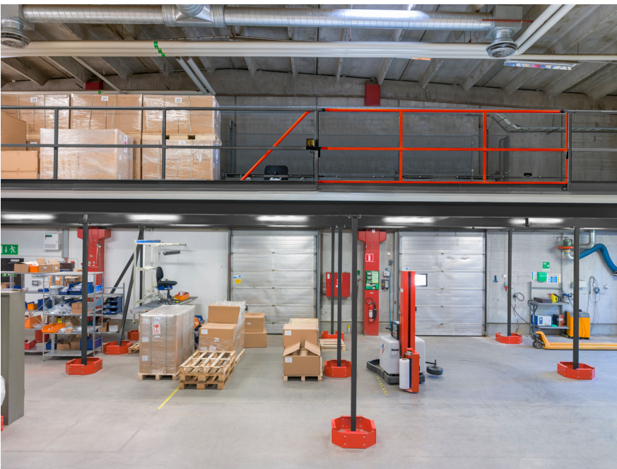
Upplastningsplats med motordriven skjutgrind. Manövrerad via radiosändare