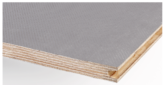
EABs entresol har en golvskena av björkplywood med en slitstark mönstrad yta av fenolfilm.