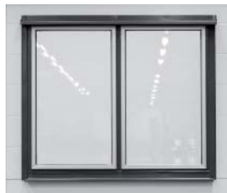
Utsida med plåtbeklädnad