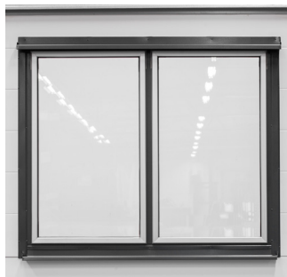
Utsida med plåtbeklädnad.

Vi vet att våra portar håller - och att de håller vad vi lovar. Därför ingår alltid 10 års garanti oavsett vilken lösning du väljer. Varje port tillverkas i Smålandsstenar och vi kan konsten att kombinera form, funktion och hållbarhet.