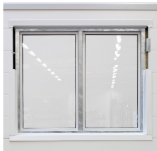
Insida med varmförzinkad karm.