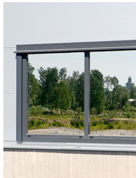
Termofönster med grålackerad plåtbeklädnad.