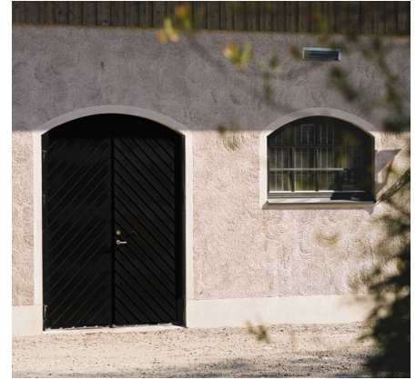
Genuint lantligt - välvd, träbäklädd port med fiskbensmönster.