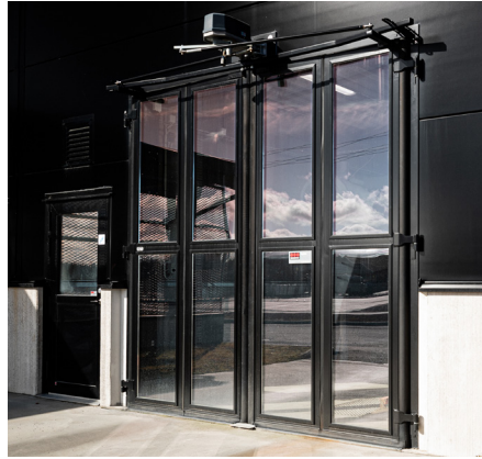
Klassiskt modernt - helglasad vikport med svartlackerad karm, enhetligt med byggnadens fasad.