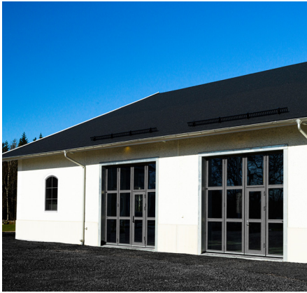
Enhetliga, helglasade vikportar med infälld gångdörr. Designline-utförande i maskinhall.