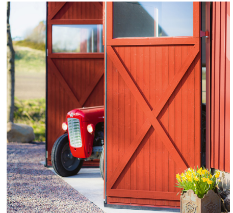
Genuint lantligt - träbäklädd vikport med klassiska kryss, en rad glas för naturligt ljusinsläpp.