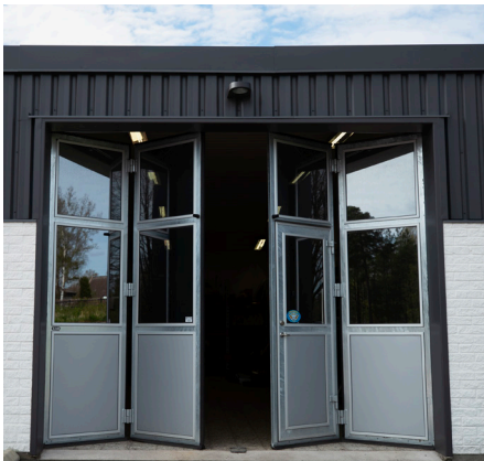
Kombinera glaspartier och slätplåt, 4-delad, inåtgående vikport med infälld gångdörr.